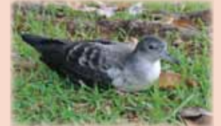
不時着うすくまってしまったオナガミスナギドリ

11 月に入り、ミスナギドリの巣立ちシーズンとなりました（12 月中旬頃まで）。ミスナギドリは光に集まる習性を持つため、町の光に近づき不時着してしまいます。不時着してしまった個体は交通事故やノネコに襲われやすいなど危険がいっぱい!! 簡単なレスキュー方法を学んで、うすくまっているミスナギドリを見つけたら、適切に野生に帰してあげましょう。